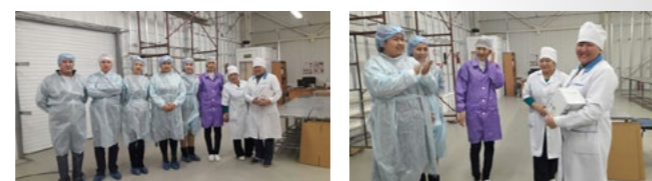
Фото: вручение приза Кусаиновой А.